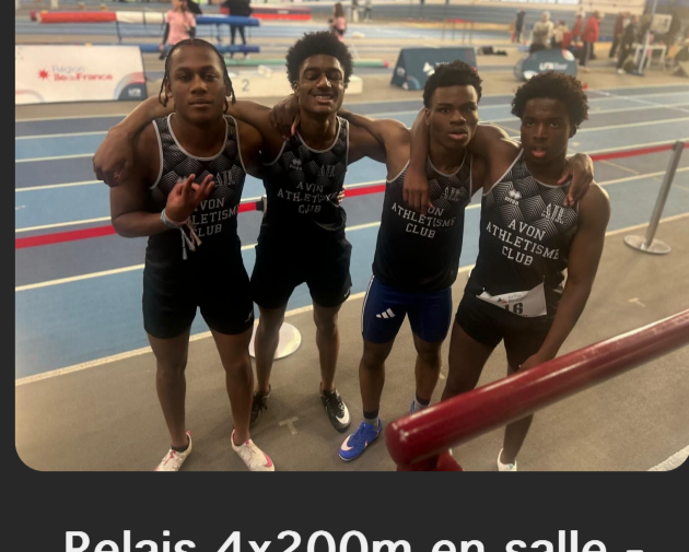
Relais 4x200m en salle - Championnat de France