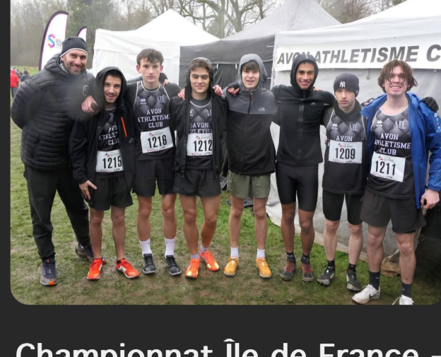
Championnat Ile de France - cross