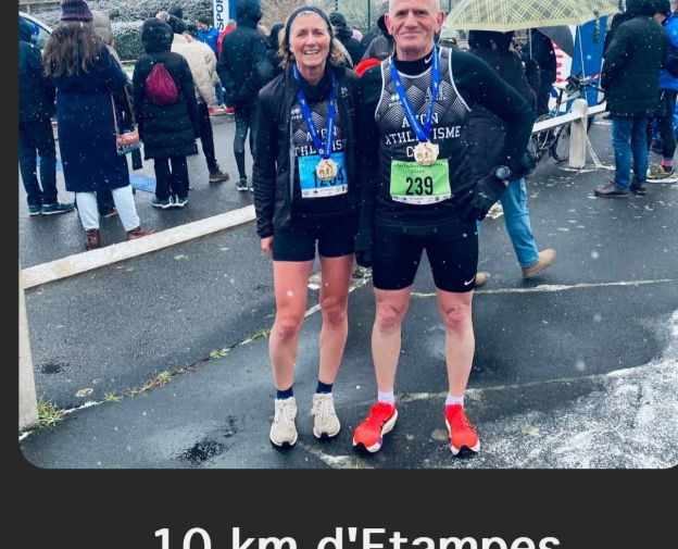
10 km d'Etampes