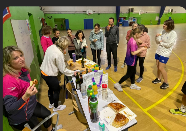
Galette des rois à la PPG