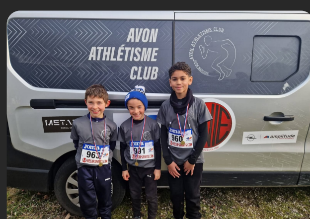
Eveil athlé Championnat 77 cross court