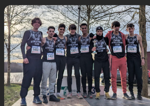
Victoire par équipe junior Championnat 77 cross tc