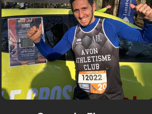
Cross du Figaro