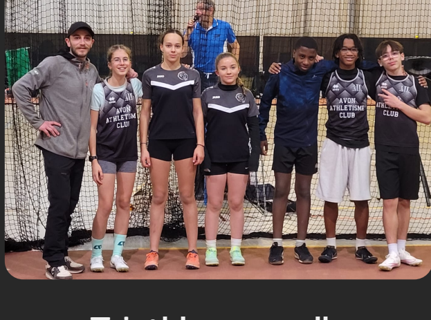
Triathlon en salle Championnat 77