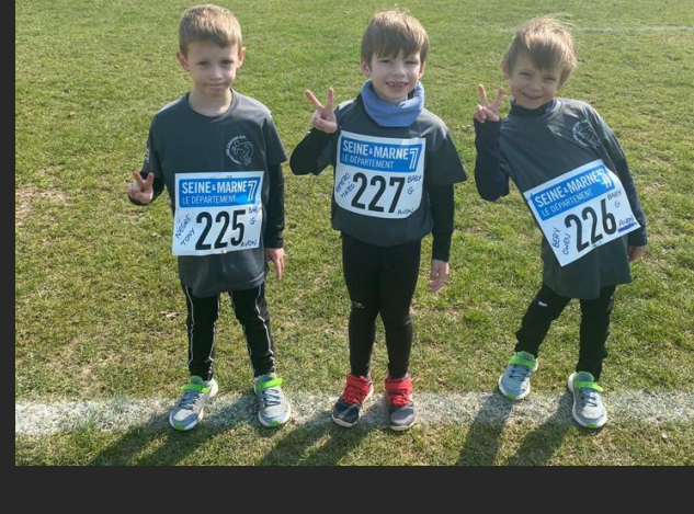
Cross des Jeunes